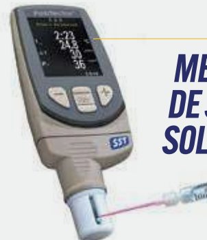
MEDIDOR DE SALES SOLUBLES