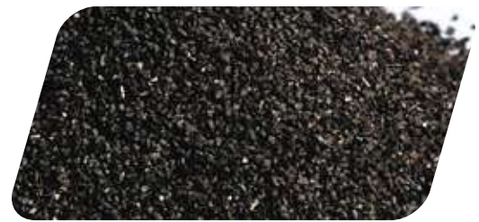
GRANALLA METÁLICA EN DIFERENTES GRANULOMETRÍAS