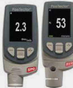
MEDIDOR DE RUGOSIDAD