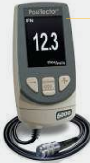
MEDIDOR DE ESPESORES EN PELÍCULA SECA