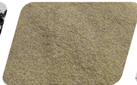
ÓXIDO DE ALUMINIO