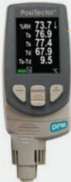
MEDIDOR DE VARIABLES AMBIENTALES