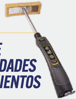
DETECTOR DE DISCONTINUIDADES EN RECUBRIMIENTOS