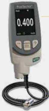
MEDIDOR DE ESPESOR DE CHAPA