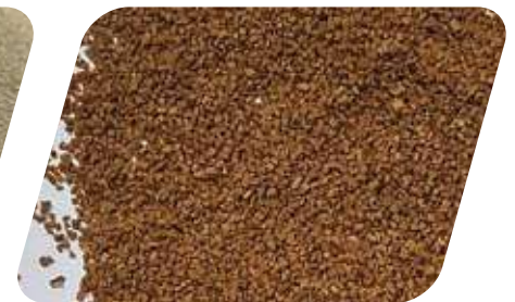
CÁSCARA DE NUEZ