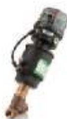
290 Positioner D